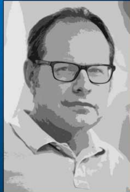
OBERSTUDIENDIREKTOR GÜNTER JAHN